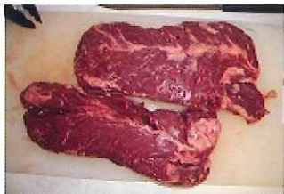
規格:8PC 単量:約 10.7kg