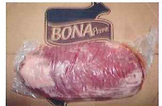
規格:10PC 単量:約 12.3kg