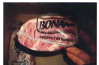
規格:2PC 単量:約 9.2kg