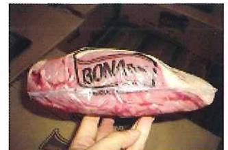
規格:2PC 単量:約 10.1kg