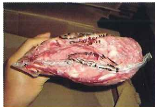
規格:2PC 単量:約 10.5kg