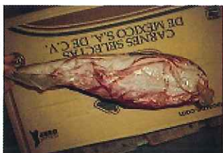
規格:6PC 単量:約 6.2kg