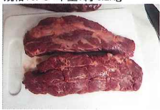
規格:8PC 単量:約 9.8kg

最新の商品取扱や在庫状況、 価格などについての問い合わせ は弊社担当営業までお願い いたします。 川島食品株式会社