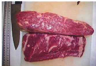
規格:8PC 単量:約 8.5kg