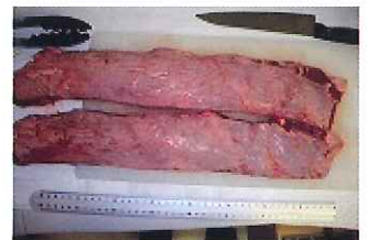
規格:8PC 単量:約 8.6kg