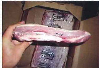
規格:4PC 単量:約 15.9kg