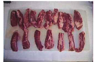
規格:8PC 単量:約 7.4kg