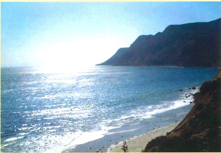
カリフォルニア湾

昔から牛・豚の生産地として知られているメキシコのソノラ州にあり 中でも良質のホワイトコーンや小麦の生産地であるオブregon市に位置しています。西はカリフォルニア湾 東はシエラマドレ山脈に囲まれ病原菌の発生を最小限に抑えられるという最適な環境の中で飼育が行われています。