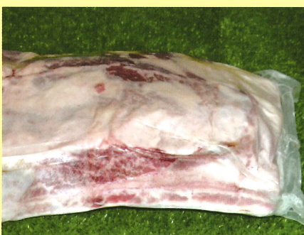
ボンインショートリブ