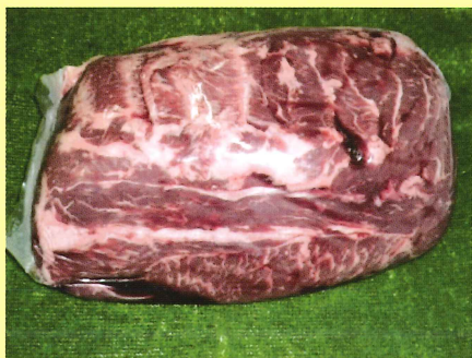
チャックアイロール