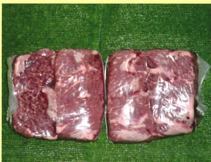
チャックフラップ