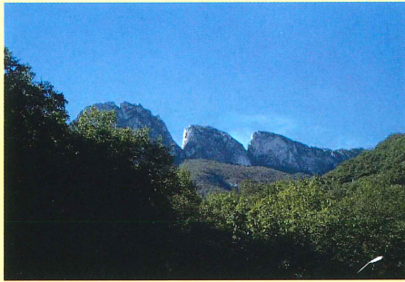
シエラマドレ山脈