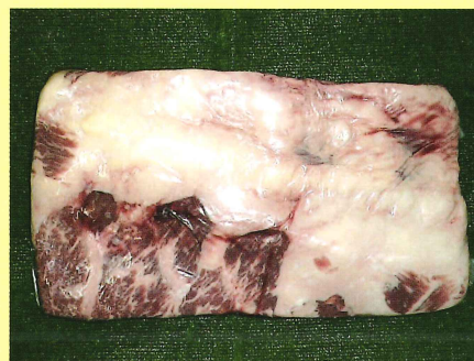
ショートプレート