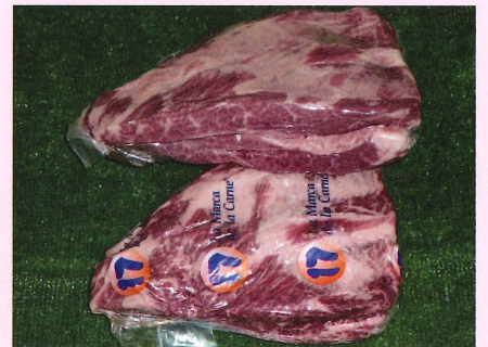
ボンレスショートリブ