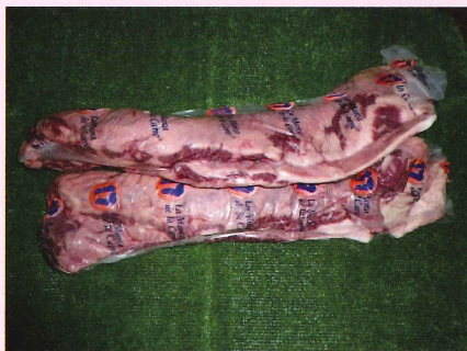
アウトサイドスカート