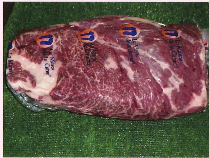
チャックアイロール