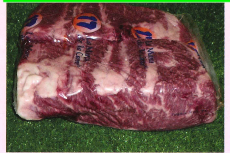
チャックフラップ