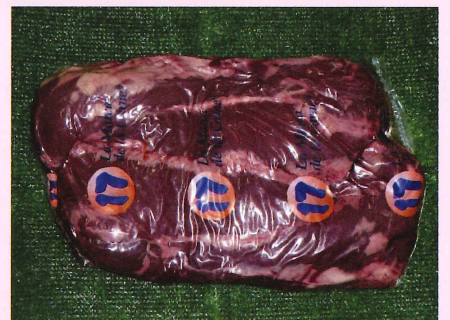
ハンギングテンダー