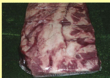
ショートプレート