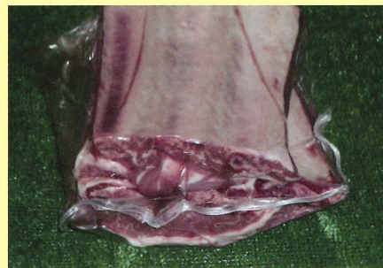
ボンインショートリブ