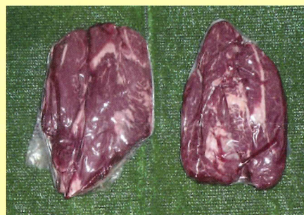
スジナシハンテン