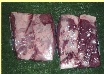
チャックフラップ