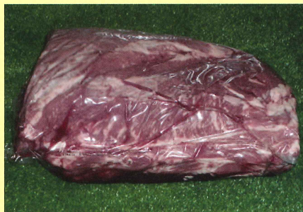
チャックアイロール