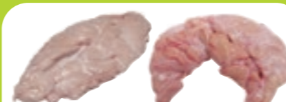
オランダ産 チルド ミルクフェッドヴィール 仔牛 リードウォー(スロート) ブロック [1パック:約1.0~1.45kg入り]