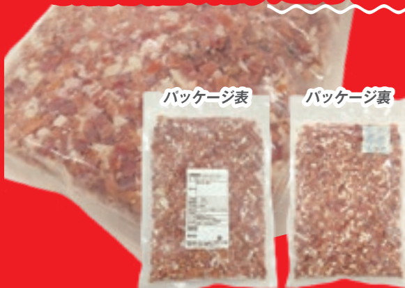
冷凍 生ハム ダイスカット (生食可能) [1パック:500g]