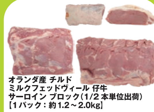
オランダ産 チルド ミルクフェッドヴィール 仔牛 サロイン ブロック(1/2 本単位出荷) [1パック:約1.2~2.0kg]