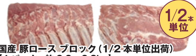
国産 豚ロース ブロック(1/2 本単位出荷) [1パック:約2.2~2.8kg]