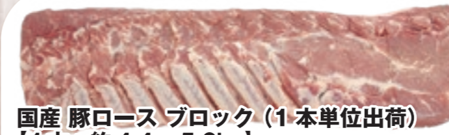
国産 豚ロース ブロック(1 本単位出荷) [1本:約4.4~5.6kg]