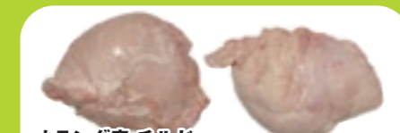
オランダ産 チルド ミルクフェッドヴィール 仔牛 リードウォー(ハート) ブロック [1パック:約1.0~1.45kg入り]