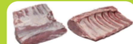
オランダ産 チルド ミルクフェッドヴィール 仔牛 チョップレディ(6 リブ/骨付きリブロース/ キャップオフ/背骨なし) ブロック [1パック:約2.4~3.0kg入り]