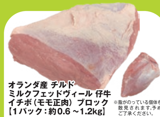
オランダ産 チルド ミルクフェッドヴィール 仔牛 イチボ(モモ正肉) ブロック [1パック:約0.6~1.2kg]