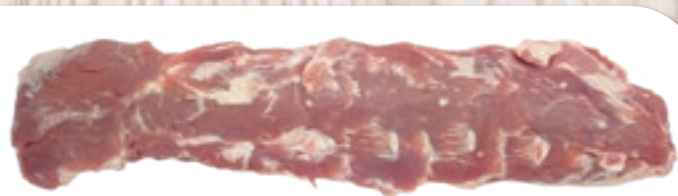
国産 豚ヒレ ブロック(1 本単位出荷) [1本:約0.5~0.7kg]