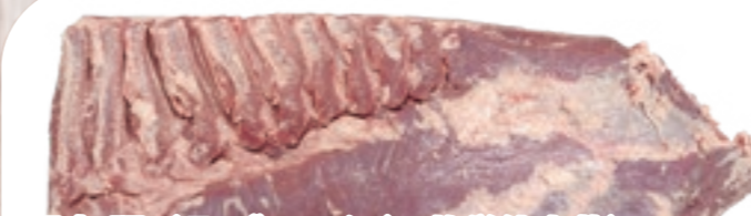
国産 豚バラ ブロック(1 枚単位出荷) [1本:約4.4~6.0kg]