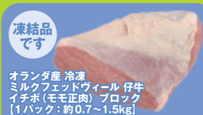
オランダ産 冷凍 ミルクフェッドヴィール 仔牛 イチボ(モモ正肉) ブロック [1パック:約0.7~1.5kg]